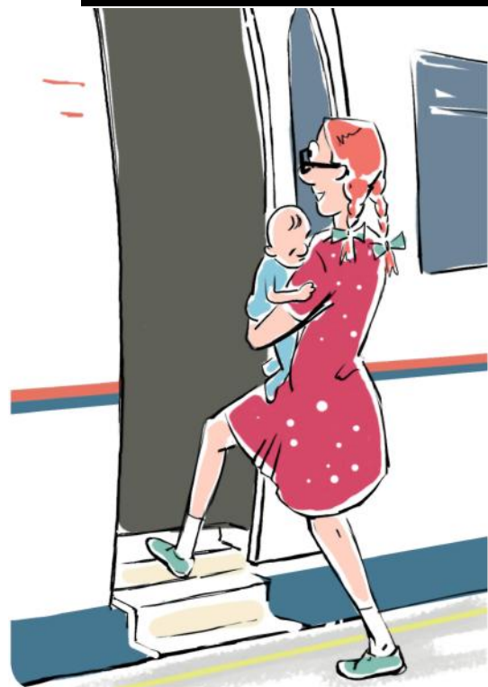
Садитесь или выходите из вагона, держа детей за руку или на руках

Помогайте пожилым людям, беременным, гражданам с детьми и людям с ограниченными физическими возможностями