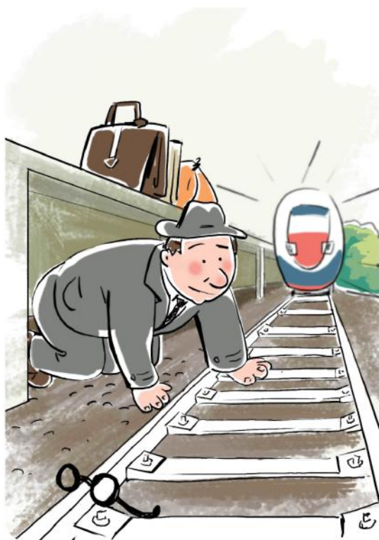
Не подлезайте под платформы и железнодорожные составы!